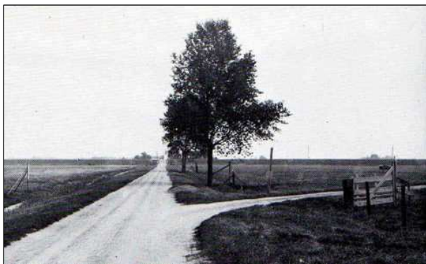
Kruising Kralingseweg-Ringvaartweg rond 1915

Waar wegen zijn moeten ook bruggen worden gebouwd, onder de titel AANBESTEDINGEN in het Nieuwsblad Heusden en Altena van 25 september 1895: "Het maken van de onderbouw voor de brug over de Ringvaart van den Prins Alexander Polder, raming fl. 10.450,00" .