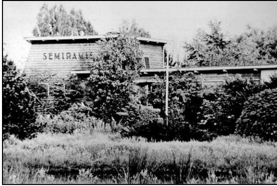
Villa Semiramis in de jaren vijftig